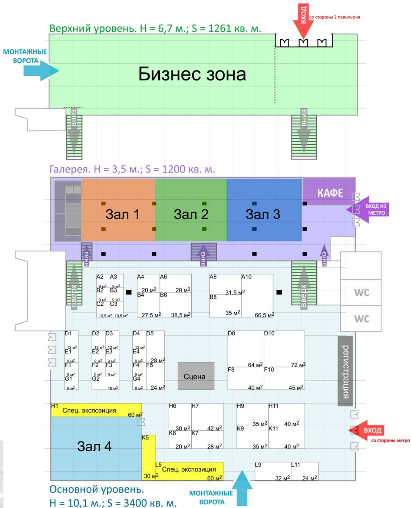
СХЕМА ПАВИЛЬОНА №3